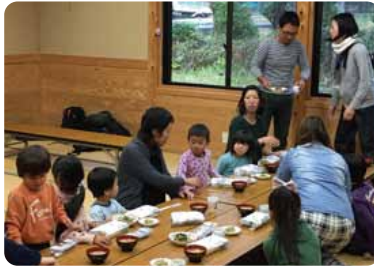
昼食・夕食交流会!