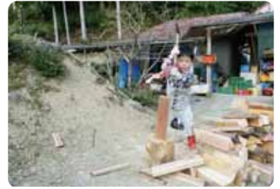
「自然と共に暮らす」を知ろう!

那智勝浦町色川地域では、民泊を起業したご夫婦や、農機具修理をナリワイに地域の人たちから頼りにされている先輩移住者を訪ねます。新宮市熊野川町の先輩移住者2組もcafe や特色あるゲストハウスを起業。それぞれのナリワイや暮らしについて話を聞いてみよう!