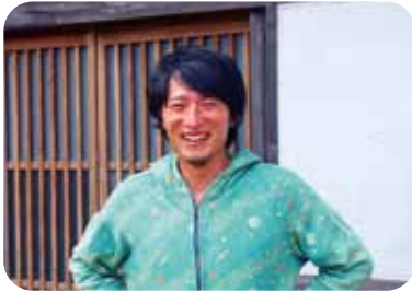
先輩移住者を訪問!