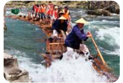
筏師をはじめとする先輩移住者と交流会!

移住前から移住後までのわかやま暮らしをサポートするふるさと定住センター。 その利用方法を聞いてみよう。 センター所在地の古座川町内もご案内します!