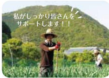
ふるさと定住センター見学!

本州最南端の農家カフェ。 農業をしたい、子育て環境をよくしたいとの思いで東京から移住。 お子さんの同級生の母親と3人で協力し自家栽培の新鮮野菜を使ったランチや手づくりパンを提供中。