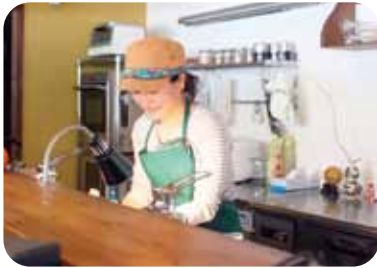
先輩移住者の農家カフェ訪問!

本州最南端の農家カフェ。 農業をしたい、子育て環境をよくしたいとの思いで東京から移住。 お子さんの同級生の母親と3人で協力し自家栽培の新鮮野菜を使ったランチや手づくりパンを提供中。