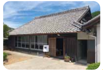
人気の地域を訪問！

交流会は地域の方や先輩移住者、子どもたちも参加して、賑やかでざっくばらんな雰囲気です。この機会にいろんな人と話をして地域の人と知り合いになろう。地元の食材を使った素朴でおいしい食事も魅力。地域の食文化にも触れてみよう！