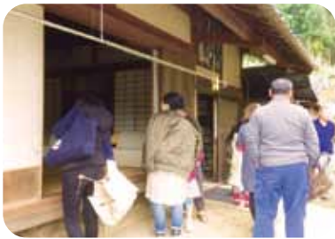
先輩移住者を巡る！

単身の方、ご夫婦、ファミリーまで日高川町に暮らす先輩移住者3組を訪問！ここでの暮らしについて色々聞いてみよう。気になる生活コストやご近所さんとの付き合い、お仕事や子供の学校のコトなどなど・・・今お住まいの住宅改修事例見学も。参考になること間違いなし!!