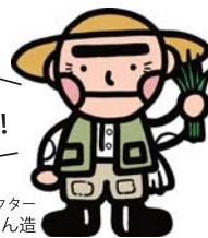
和歌山移住応援キャラクター ほんまもん造