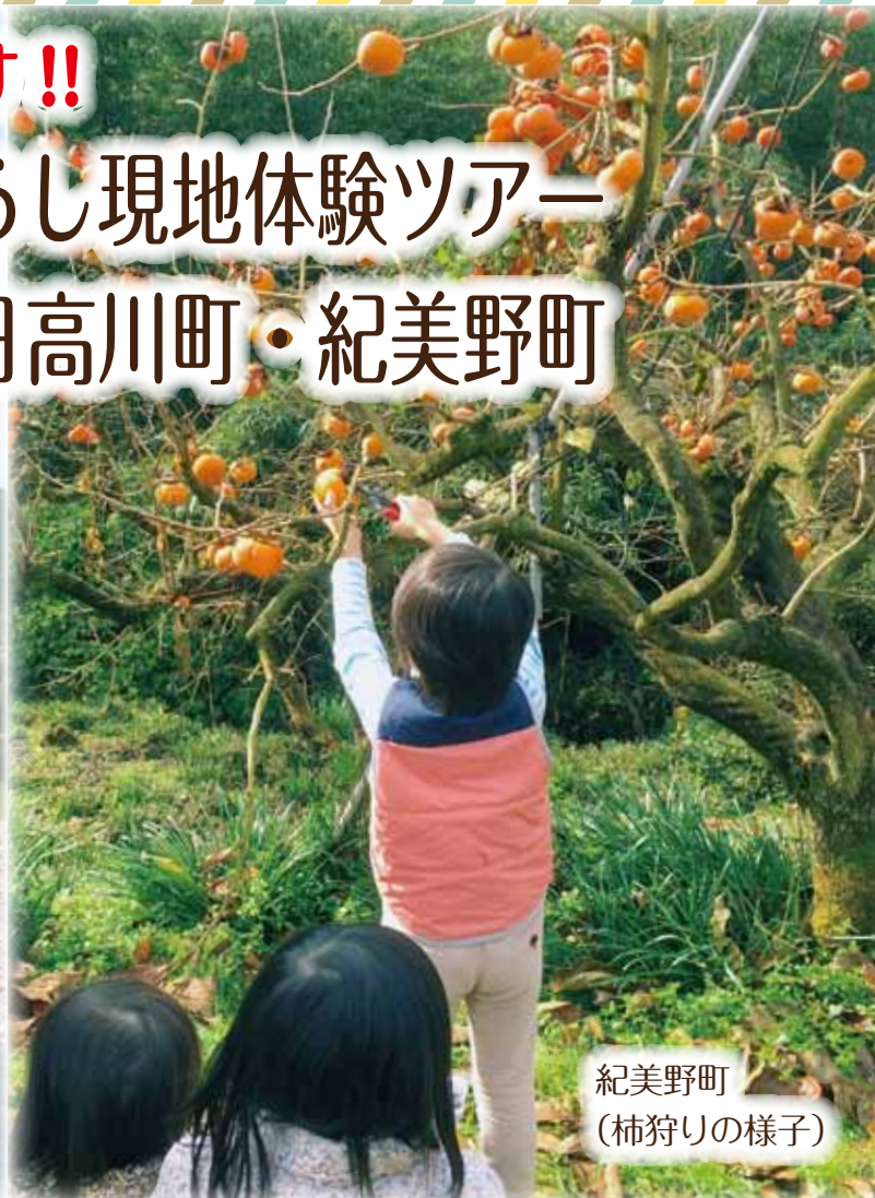
紀美野町 (柿狩りの様子)