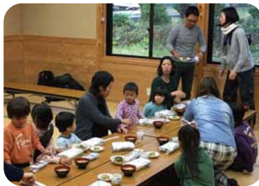
昼食・夕食交流会！

単身の方、ご夫婦、ファミリーまで日高川町に暮らす先輩移住者3組を訪問！ここでの暮らしについて色々聞いてみよう。気になる生活コストやご近所さんとの付き合い、お仕事や子供の学校のコトなどなど・・・。今お住まいの住宅改修事例見学も。参考になること間違いなし！！