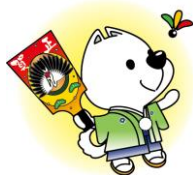
きいちゃん 和歌山県PRキャラクター